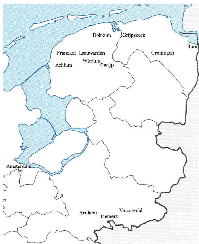
3. Kaart van Noord- en Oost-Nederland met de belangrijkste woonplaatsen van de families Vlaskamp, Beekhuis en Cloeck.

En zo zijn we er achter gekomen, wie de afgebeelde personen werkelijk waren. Familieleden van de bezitters van de portretten vertelden mij over het bestaan ervan en zij hadden de gehele familiegeschiedenis uitvoerig in beeld gebracht op hun website (voorouders.jimdo.com).